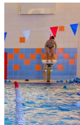
На фотографии 3 «а» класс