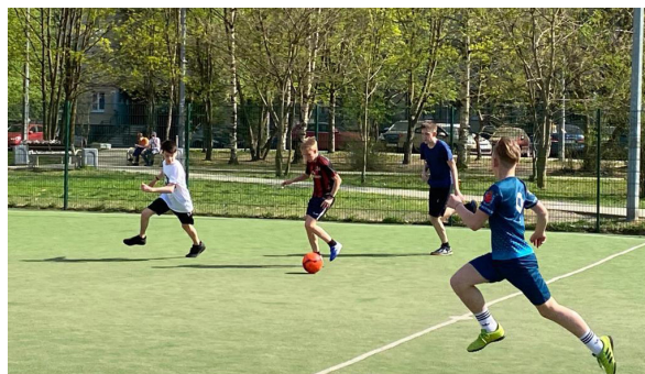
На фотографии команда 7 «А» класса - абсолютный победитель Спортакиады по футболу среди 7-8 кл.