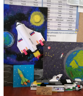
На фотографии работы конкурса поделок ко Дню космонавтики