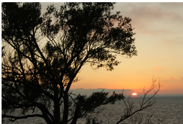
На фотографии место, где произошло событие