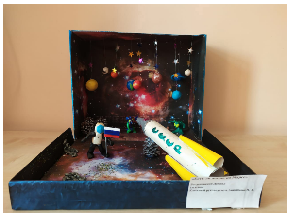
На фотографии конкурсная работа Д. Богдановского, 1 «Ж» класс