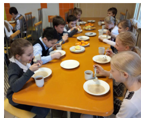
На фотографии 3 «а» класс