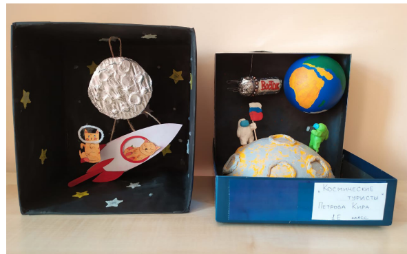
На фотографии конкурсные работы К.Петровой, 1 «Е» класс

В апреле среди обучающихся первых классов лицея проходил конкурс «Космические фантазии», посвященный 60-летию со дня первого в истории человечества полета в космос. В нём приняли участие первоклассники.